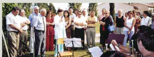
2005 : 10 ème anniversaire de la Rosée du Pré