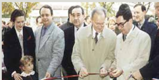
Inauguration de l'établissement le 3 décembre